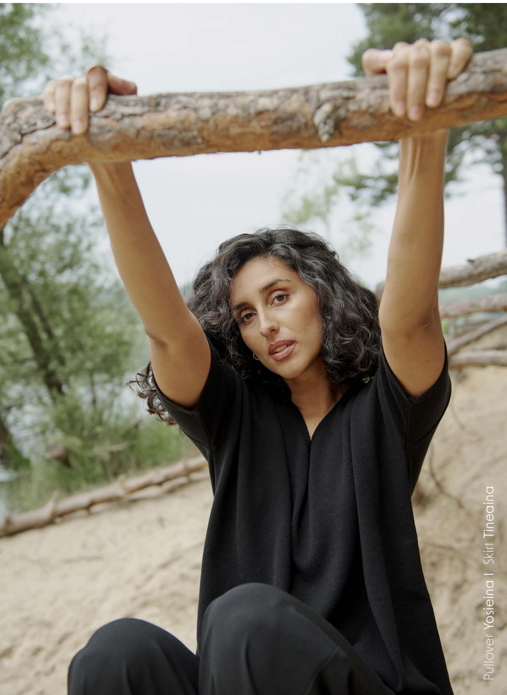
Pullover Yosfeina | Skirt Tineaina