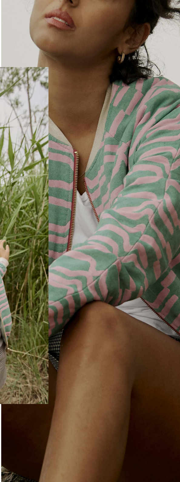
Jacket Julieina | Shorts Luvinaina