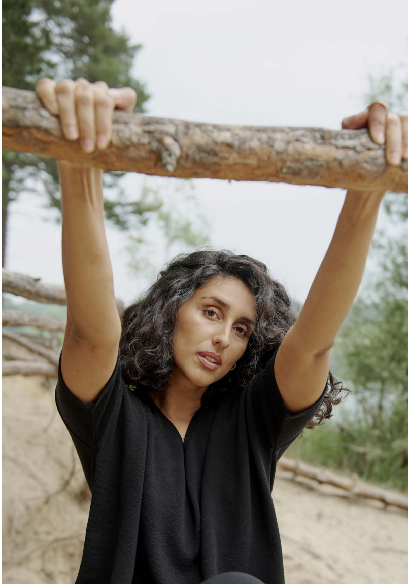
Shirt Yarina | Trousers Soleilina