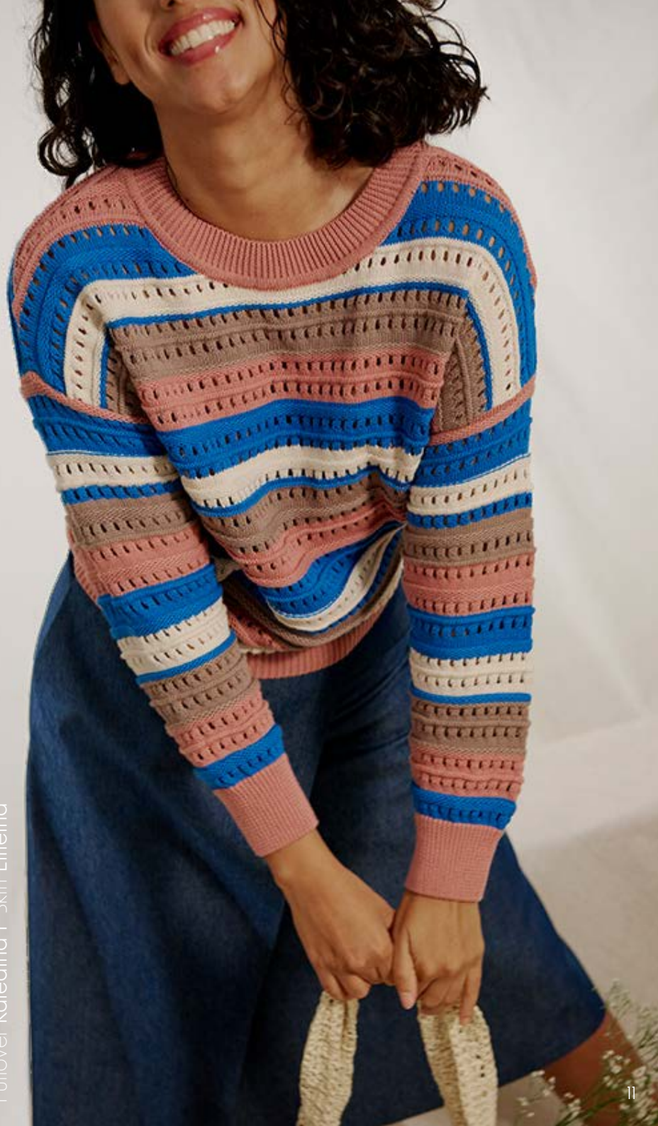
Pullover Kaleaia I Skirt Elfieina