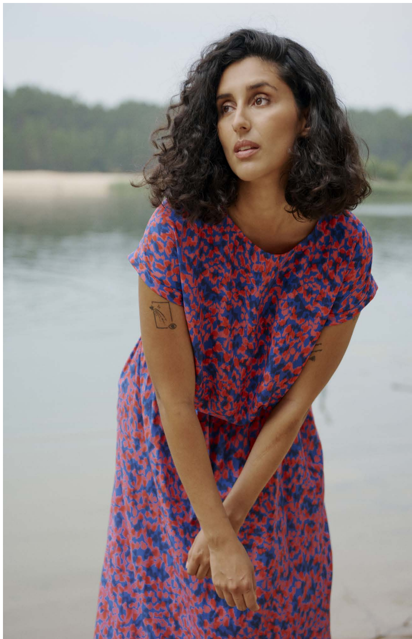
Blouse Pattiyina | Skirt Roycina